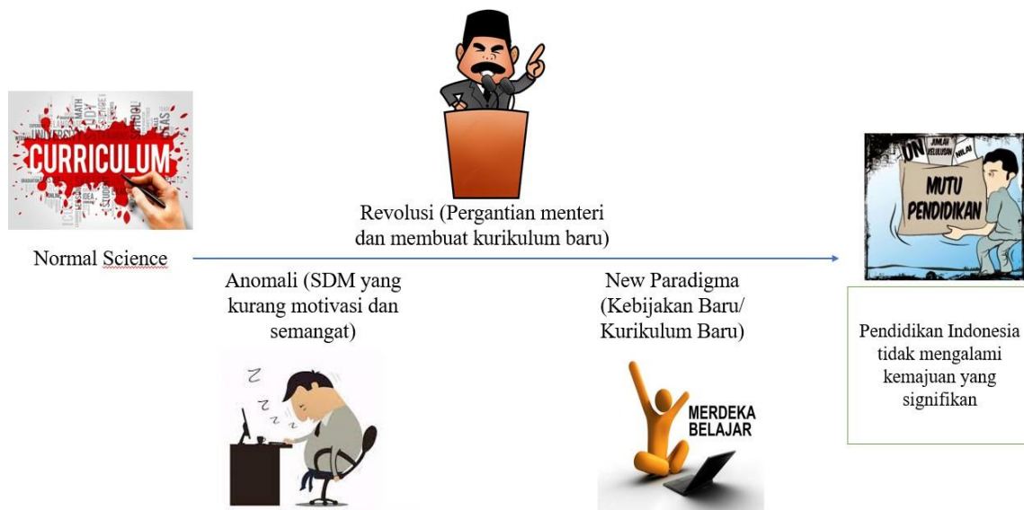
Gambar 2. Paradigma Kuhn dalam Pendidikan Indonesia Saat Ini

Gambar 2 tersebut menggambarkan bahwa, cara yang ditempuh dalam mengantisipasi masalah pendidikan di Indonesia adalah menciptakan kurikulum yang baru yang ditandai dengan pergantian menteri pendidikannya terlebih dahulu. Berdasarkan hal tersebut, dapat dikaji tahapan-tahapan paradigma Thomas Kuhn dengan mengaitkannya pada fakta pendidikan dan pergantian kurikulum di Indonesia.