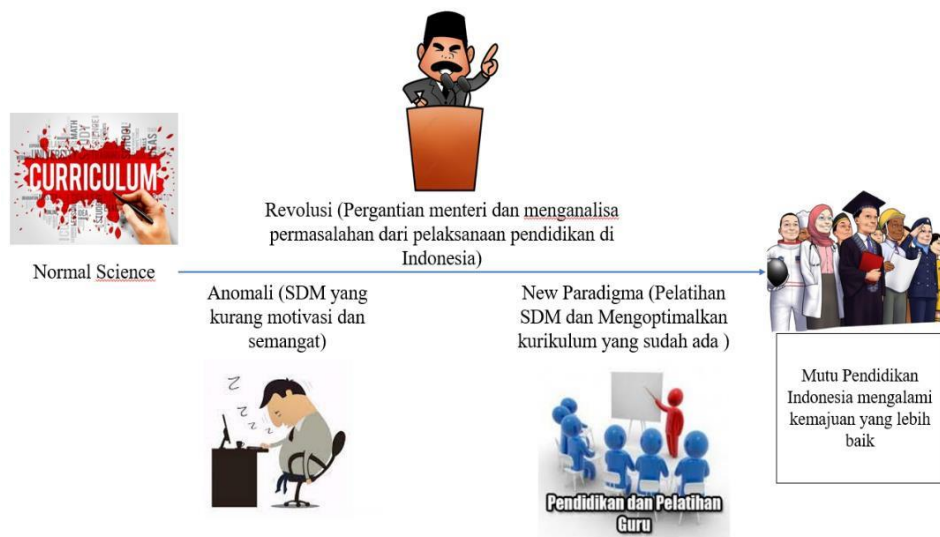
Gambar 3. Paradigma Kuhn Yang Diharapkan di Pendidikan Indonesia

Berdasarkan Gambar 3 di atas, pemberdayaan SDM diharapkan dapat mengganti level pandangan masyarakat Indonesia terhadap pendidikan yang semula berada low (pendidikan itu sebuah hal yang mahal) menjadi mid range (pendidikan itu perlu untuk kehidupan yang lebih baik) dan High Range (Pendidikan itu merupakan sebuah kebudayaan). Sehingga dengan menciptakan SDM yang punya kompetensi di masing-masing bidangnya dalam pendidikan Indonesia diharapkan dapat menciptakan masyarakat yang mempunyai pandangan bahwa pendidikan Indonesia itu merupakan kebudayaan dalam mencerdaskan kehidupan bangsa.