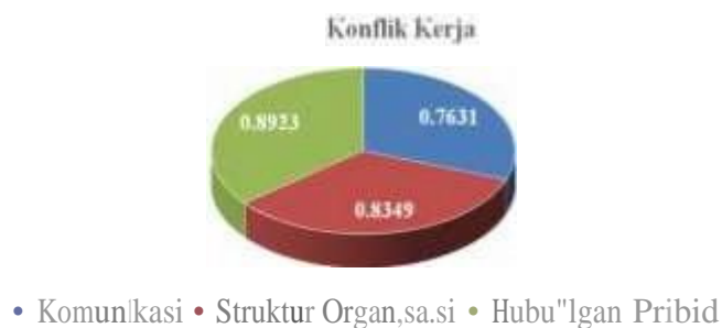
Gambar 2. Sub Variabel Konflik Kerja

Konflik kerja dapat memenuhi dengan baik antar karyawan lainnya maupun dengan diri sendiri dalam melaksanakan pekerjaannya dengan baik. Pada komunikasi memiliki presentase sebesar 76,31 (baik) dan struktur organisasi memiliki presentase sebesar 83,49 (baik). Dan hubungan pribadi memiliki presentase sebesar 89,23 (sangat baik). Lebih jelasnya hasil klasifikasi tersebut dapat dilihat pada gambar grafik dibawah ini: