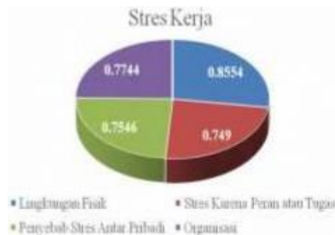
Gambar 3. Sub Variabel Stres Kerja

memiliki presentase sebesar 85,54 (sangat baik), stress karena peran atau tugas memiliki presentase sebesar 74,9 (baik), penyebab stress antar pribadi memiliki presenatase sebesar 75,46 (baik) dan organisasi memiliki presentase sebesar 77,44 (baik). Lebih jelasnya hasil klasifikasi tersebut dapat dilihat pada gambar grafik dibawah ini :