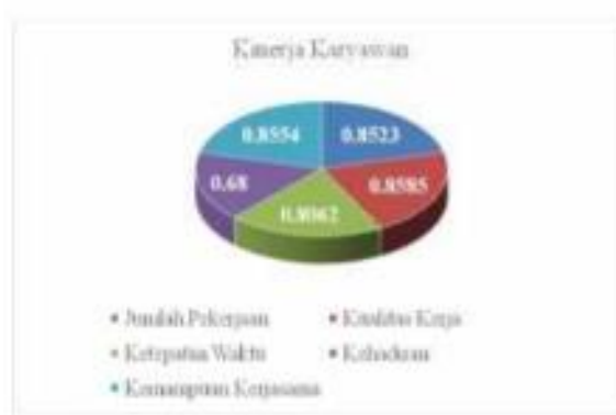
Gambar 4. Sub Variabel Kinerja Karyawan

Kinerja karyawan dapat memenuhi tujuan perusahaan agar tercapai. Pada jumlah pekerjaan memiliki presentase sebesar 85,23 (sangat baik), kualitas kerja memiliki presentase sebesar 85,85 (sangat baik), ketepatan waktu memiliki presentase sebesar 80,62 (baik), kehadiran memiliki presentase sebesar 68% (cukup) dan kemampuan kerjasama memiliki presentase sebesar 85,54 (sangat baik). Lebih jelasnya hasil klasifikasi tersebut dapat dilihat pada gambar grafik dibawah ini: