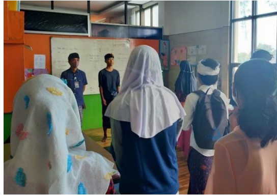
Gambar 3. Sosialisasi Kegiatan

dengan pihak yayasan, memastikan kesiapan sarana dan prasarana, serta menyelaraskan harapan antara tim pengabdian dan mitra agar pelaksanaan kegiatan dapat berjalan efektif dan tepat sasaran.