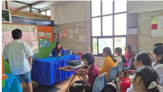
Gambar 7. Pemaparan Materi Tari Modern

kegiatan tersebut selesai maka kegiatan dilanjutkan dengan kegiatan pelatihan seni tari modern. Kegiatan dimulai dengan pemaparan seni tari modern yang akan dipraktikkan, dan kemudian pelatihan seni tari modern diakhiri dengan praktik tari modern oleh narasumber dan perwakilan peserta didik Yayasan PKBM Dharma Wangsa.