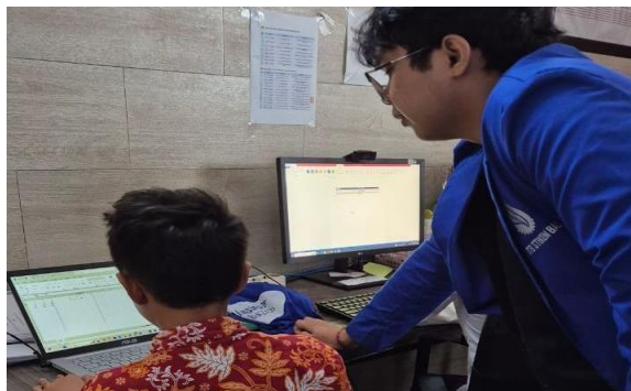
Gambar 8. Praktik Microsoft Office

Setelah sesi pemaparan selesai, kegiatan pengabdian masyarakat dilanjutkan dengan sesi praktik Microsoft Office yang dilaksanakan di ruangan TIK milik Yayasan Dharma Wangsa. Praktik dibagi menjadi 3 sesi yang di mana per sesi dilakukan oleh 8 peserta didik. Peserta didik diberikan tugas untuk membuat file Microsoft Word sesuai dengan materi yang telah dipaparkan pada sesi presentasi, yang kemudian dilanjutkan dengan pembuatan file Microsoft Excel sesuai dengan materi yang telah dipaparkan. Setiap peserta didik dibimbing oleh satu panitia yang bertugas untuk membantu peserta yang masih mengalami kesulitan dalam menyelesaikan tugas. Selain itu, pendekatan one-on-one ini dilakukan untuk memastikan seluruh peserta benar-benar memahami tahapan penggunaan aplikasi serta mampu menghasilkan dokumen yang sesuai dengan kriteria yang telah ditetapkan.