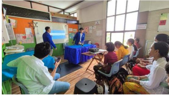
Gambar 5. Pemaparan Microsoft Word

numbering , kemudian dilanjutkan dengan cara mengatur tata paragraf, dan diakhiri dengan cara menautkan foto dan shape menggunakan fitur insert . Acara dilanjutkan dengan sesi tanya jawab dengan peserta sebelum dilanjutkan dengan sesi pemaparan materi Microsoft Excel. Selama proses berlangsung, peserta diberikan kesempatan untuk mempraktikkan langsung setiap langkah yang dijelaskan, sehingga pemahaman mereka semakin kuat dan keterampilan menggunakan aplikasi dapat meningkat secara optimal.