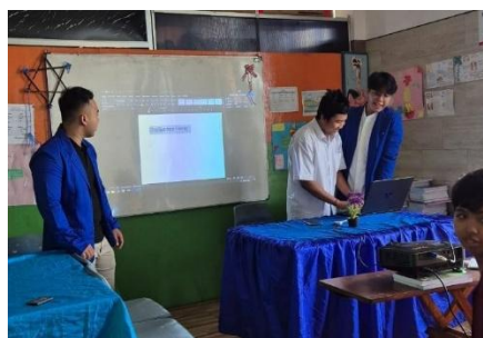
Gambar 6. Pemaparan Microsoft Excel

Materi Microsoft Excel mencakup fungsi-fungsi dasar penghitungan menggunakan Excel. Peserta didik diajarkan bagaimana cara menghitung menggunakan fungsi dasar berikut: “=A1+B1” untuk melakukan penghitungan pada kolom A1 dan B1. Fungsi dituliskan pada kolom C1 untuk mengetahui hasil dari fungsi tersebut. Setelah itu dibuka sesi tanya jawab untuk pemaparan materi Microsoft Excel. Selain itu, peserta juga diberikan pemahaman mengenai pentingnya penguasaan Excel dalam pengolahan data sehari-hari, serta contoh penerapan rumus dasar untuk membantu menyelesaikan tugas akademik maupun administrasi secara lebih cepat dan efisien.