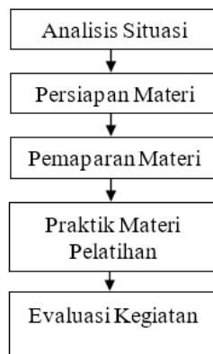
Gambar 2. Rencana Kegiatan

Gambar 2 menggambarkan rencana dari kegiatan pengabdian masyarakat yang akan dilaksanakan pada mitra. Melalui gambar tersebut, terlihat tahapan kegiatan yang telah disusun secara sistematis mulai dari persiapan, pelaksanaan, hingga evaluasi untuk memastikan program berjalan optimal dan memberikan manfaat maksimal bagi peserta didik dan pihak yayasan.