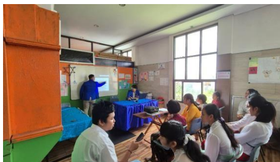
Gambar 4. Pengenalan Kegiatan

Pada tanggal 07 November 2024, kegiatan pengabdian masyarakat yang bertemakan “Pemanfaatan Microsoft Office Dalam Metode Pembelajaran Dan Peningkatan Motorik Serta Kreativitas Melalui Seni Tari Modern di PKBM Dharma Wangsa” dilaksanakan. Acara dimulai dengan pengenalan panitia dan narasumber, pengenalan kegiatan kepada peserta, dan pemaparan alur kegiatan pengabdian masyarakat. Selain itu, peserta juga diberikan gambaran mengenai tujuan kegiatan, manfaat yang diharapkan, serta aturan pelaksanaan agar seluruh rangkaian acara dapat diikuti dengan baik dan berjalan sesuai dengan rencana.