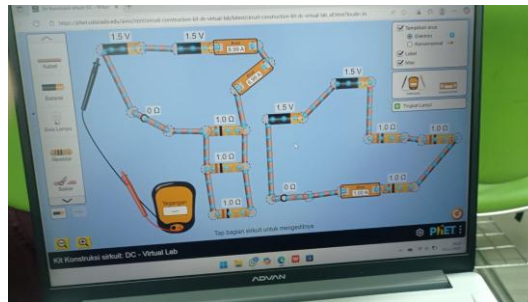
Gambar 2. Tampilan rangkaian seri-paralel dalam simulasi PhET

Keunggulan simulasi PhET adalah tidak adanya error fisik seperti kabel longgar, hambatan internal multimeter, atau toleransi resistor, sehingga hasil yang diperoleh lebih ideal.