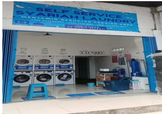
Gambar 1. Usaha Laundry “Waz Wuz Madura”

mencuci pakaiannya sendiri di mesin cuci. Namun bagi customer yang merasa kesulitan mencuci menggunakan mesin cuci, juga bisa meminta pelayanan dari penjaga kasir laundry. Keunggulan lain dari usaha laundry ini adalah selalu rutin menawarkan promo “Jumat Berkah”, dimana tiap hari Jumat seluruh customer laundry pada jam 08.00-10.00 dan 13.00-14.00 bisa mendapatkan promo cuci 1 gratis 1. Dalam usahanya, laundry Waz Wuz Madura memiliki 8 mesin pencuci dan 8 mesin pengering.