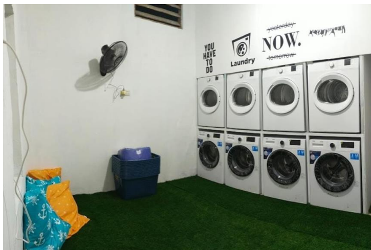
Gambar 2. Usaha Laundry “Waz Wuz Madura”

Usaha laundry hanya memiliki 1 pekerja yang bertugas sebagai penjaga laundry dan kasir. Semua dikerjakan hanya oleh 1 orang dikarenakan usaha konsep self service tidak membutuhkan banyak pekerja. Jasa yang ditawarkan pada usaha laundry ini pun juga hanya jasa cuci basah dan cuci kering. Tujuan dari tidak adanya jasa setrika adalah 1) Agar tidak perlu merekrut banyak pekerja 2) Mudah pengolahannya 3) Memudahkan pekerja dalam membuat laporan keuangan 4) Memudahkan pemilik laundry dalam mengawasi alur kas keluar dan masuk. Untuk harga yang ditawarkan adalah cuci basah Rp 10.000,- untuk kapasitas 1 sampai 5 kg. Dan pengering Rp 10.000,- kapasitas 1 sampai