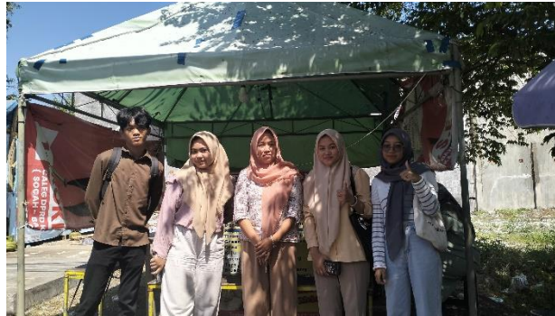
Gambar 3. Dokumentasi bersama owner