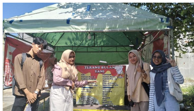
Gambar 4. Foto Kelompok

UMKM Terang Bulan Mini Bu Yani berdiri pada tahun 2022 tepatnya saat pandemi corona. Awal mula membangun usaha tersebut dengan modal keseluruhan Rp 4.000.000. Memiliki 1 karyawan wanita yang digaji sebesar Rp 800.000 per bulan dengan jam kerja 6 jam per hari, dan libur pada hari minggu. Listrik UMKM Terang Bulan Mini Bu Yani menyambung ke cafe yang ada disebelah nya yakni Cafe Swarna dengan tarif Rp 50.000 per bulan.