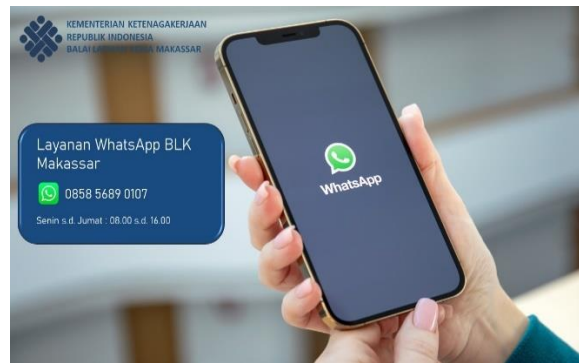
Gambar 5.1 : Layanan WhatsApp BBPVP Makassar\