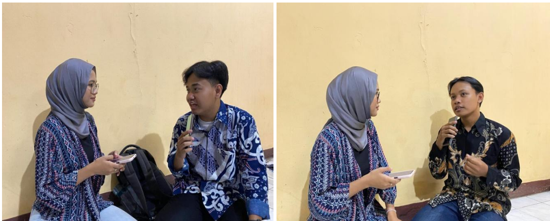
Keterangan: Foto wawancara Mahasiswa Fakultas Dakwah dan Ilmu Komunikasi UIN Jakarta pada Rabu 16 Oktober 2024.

Pada temuan data berikutnya, kami sudah mewawancarai dua mahasiswa Fakultas Ilmu Komunikasi dan Dakwah yang menonton siaran berita Pemilu 2924 tersebut untuk memberikan opininya mengenai isu terkait. Dalam wawancara ini kami menggunakan metode menyiapkan pertanyaan yang ingin kami ajukan. Selanjutnya, kami memberikan informasi terkait video siaran berita Pemilu 2024 di channel Youtube CNN Indonesia. Berikut adalah tabel hasil wawancara yang kami lakukan pada Narasumber.